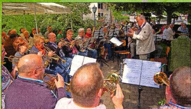
Der Posaunenchor Beenhausen / Mecklar begleitete den Gottesdienst musikalisch.