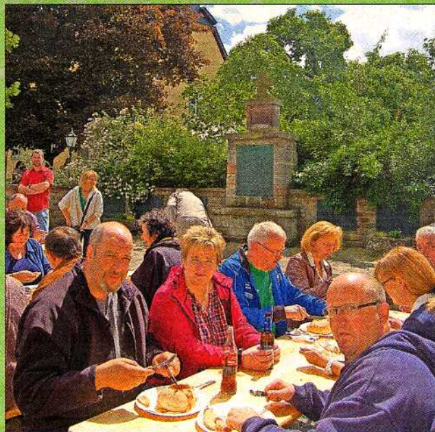
Unter blauem Himmel schmeckte das Mittagessen noch besser als sonst.