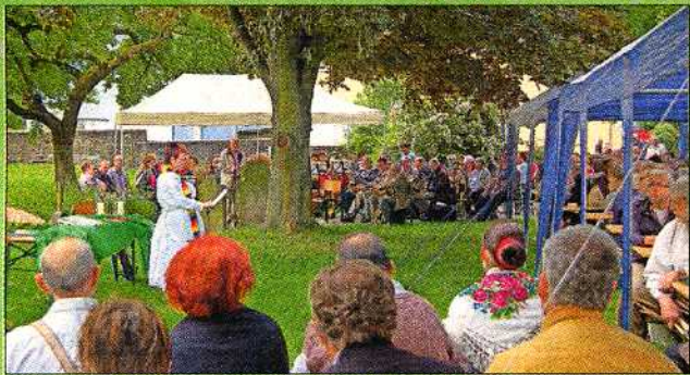
Der Festgottesdienst fand vor der Kirche statt.