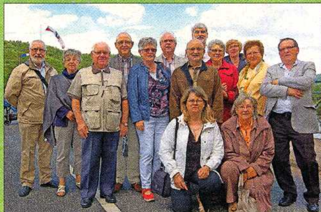
Sogar aus der Partnergemeinde Changé waren Besucher angereist.