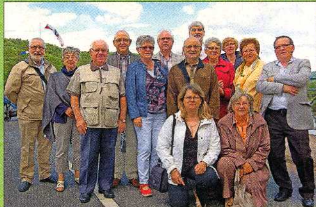
Sogar aus der Partnergemeinde Changé waren Besucher angereist.