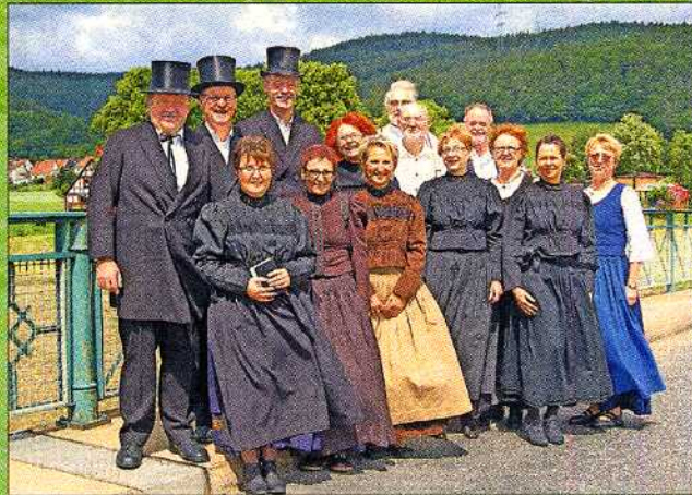
Einige Mecklarer waren in alter Tracht gekommen.

Alle Erwartungen übertroffen! So könnte man Programm und Besucherandrang beim zweiten Mecklarer Brückenfest, das am vergangenen Sonntag von der neugegründeten Vereinsgemeinschaft rund um das 1899 errichtete Mecklarer Wahrzeichen veranstaltet worden ist, zusammenfassen. Jeder Verein brachte sich mit Rat und Tat und vielen fleißigen Händen ein, und auch die Kirchengemeinde mit Pfarrerin Karin Ludwig-Heiderich an der Spitze leistete ihr „Scherlein“. Beispielsweise beim Festgottesdienst, in dem thematisch auf das Brückenfest Bezug genommen und zum Bauen zwischenmenschlicher Brücken ermutigt wurde. Zur Mittagessenszeit gab es leckere, mit Backhaus-Brot servierte Gerichte, und Kaffee und Kuchen ließen auch nicht lange auf sich warten. Mit einer kleinen, regenbedingten Verzögerung begann die Brückensportolympiade, die die Mannschaft des Kids-Clubs für sich entscheiden konnte. Nachfolgend ein paar erste fotografische Eindrücke mit Fotos von Wilfried Apel.